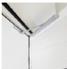
Ferme-porte supérieur intégré