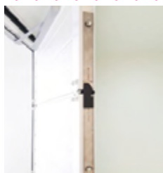
Serrure à 5 points d'ancrage