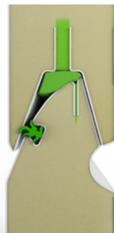
Panneaux en acier galvanisé renforcé Epaisseur 40 mm Coeur mousse isolante