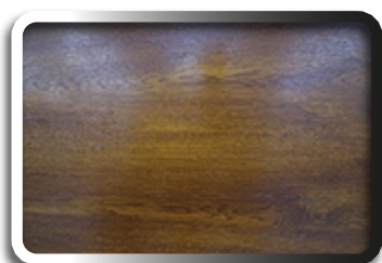
Lisse Chêne doré

Une Finition lisse pour une esthétique plus contemporaine