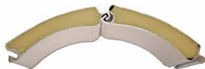
Lame alu avec isolation mousse polyuréthane - 77mm de hauteur visible - Lame finale avec joint d'étanchéité au sol

Motorisation évolutive selon la taille du tablier