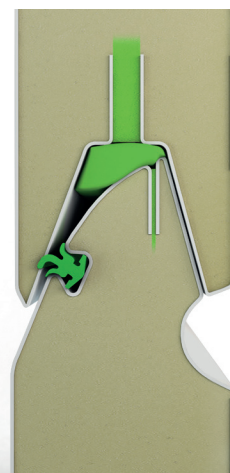
Panneaux en acier galvanisé renforcé Epaisseur 40 mm Coeur mousse isolante