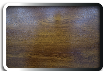
Lisse Chêne doré

Une Finition lisse pour une esthétique plus contemporaine