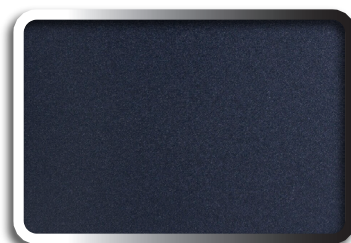
Lisse Gris anthracite

Apporte un Style contemporain très tendance !